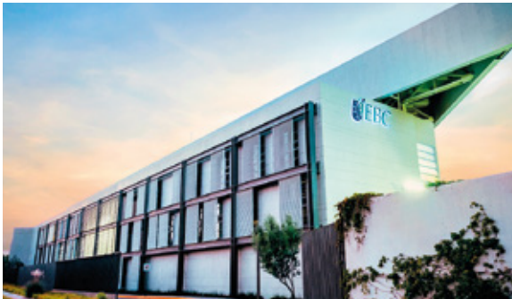
San Luis Potosí