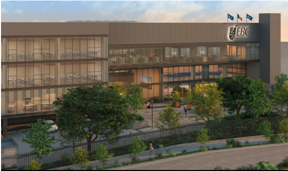
Nuevo Campus CDMX Sur