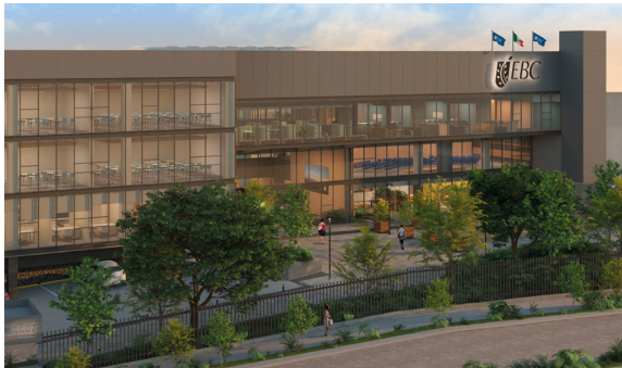
Nuevo Campus CDMX Sur