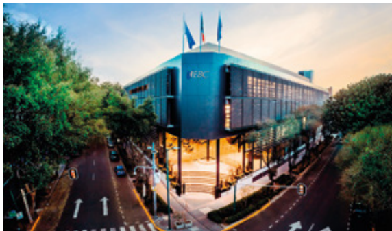
Ciudad de México